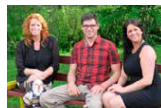
Projet : Capsules vidéo mettant en vedette des entrepreneurs locaux