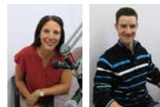
Projet : Mise en valeur des intrapreneurs et entrepreneurs locaux